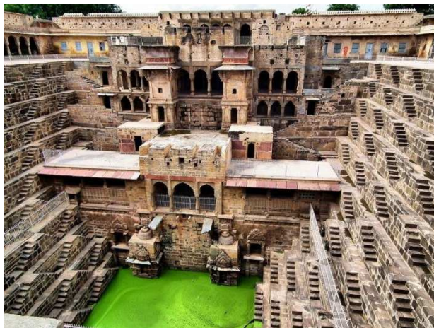
Chamd Baori (palazzo-pozzo)

Pensione completa. Partenza per Agra. Lungo il percorso sarà effettuata una sosta al piccolo villaggio di Abhaneri, con il suo incredibile "Pozzo Palazzo", vero gioiello architettonico. Successivamente sosta a Bharatpur per la visita del Parco Nazionale con il giro in rickshaw. Sosta successiva per la visita di Fatehpur Sikri, città costruita nel 1569 dall'imperatore Akbar, fu abbandonata dopo circa 14 anni. Una delle cause fu la scarsità di acqua e lentamente si trasformò in una "città fantasma". Le rovine sono molto ben conservate e si potranno visitare il Jama Masjid, la Tomba di Salim Christi e il Panch Mahal, a testimonianza della grandezza e dello splendore dell'impero Moghul. Proseguimento infine per Agra. Arrivo, sistemazione in hotel, cena e pernottamento.